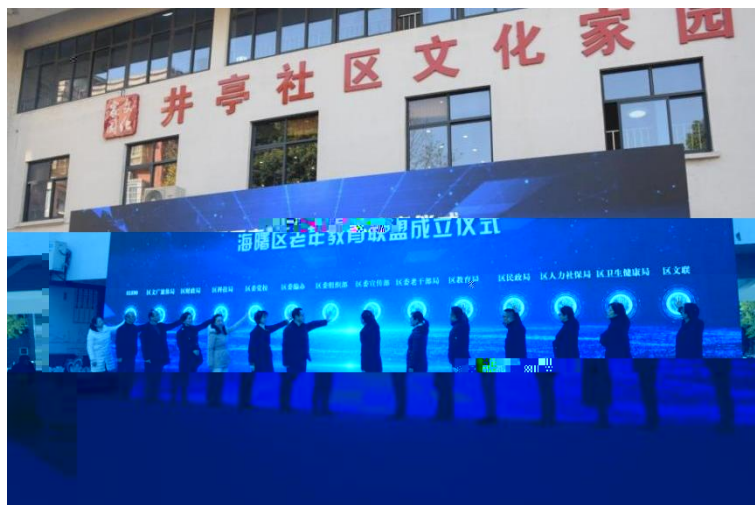
“ ” 仪

(一) 党 ， 一 “ ” 井亭 以 “ ” 党 为 ， 党 、 党 、 业 党 互 互 ， 为 ， 不 凝 。 人 ， 共 共享 ， “共 ” 。 下，全 一 “ ” 井亭 。